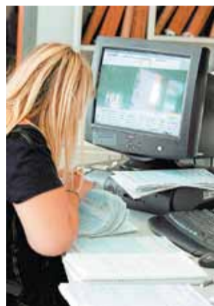
Ο φόβος εγκλωβισμού στην αγορά εργασίας – πέρα από τις όποιες διαφοροποιήσεις ανά ασφαλιστικό φορέα – επηρεάζει περισσότερο τις γυναίκες

Ανάμεσα στα μέτρα που θα τεθούν στο τραπέζι για τις αλλαγές στο Ασφαλιστικό είναι να μη χορηγείται καμία σύνταξη πριν από τα 62 χρόνια